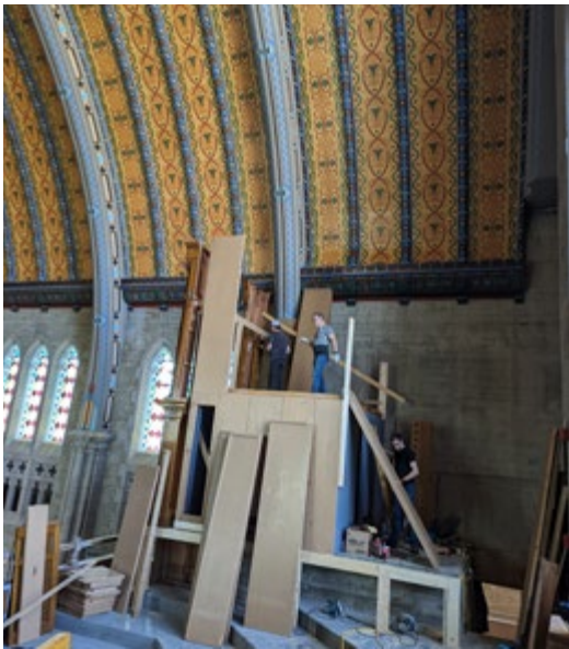
Un peu plus haut, un peu plus loin...