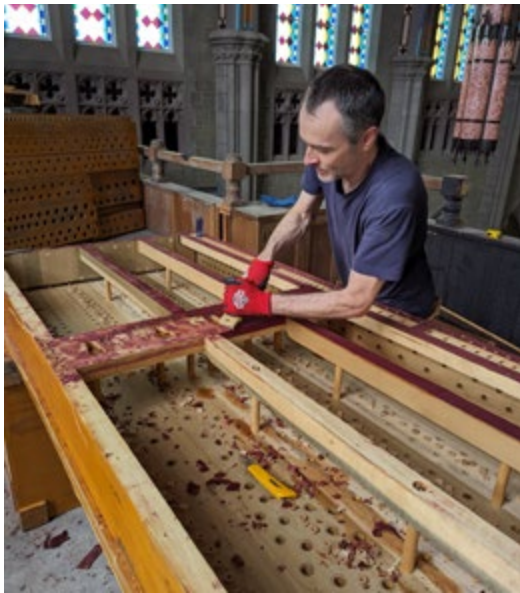
Patience et minutie